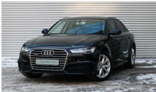
Фотография от 21 января 2019 года